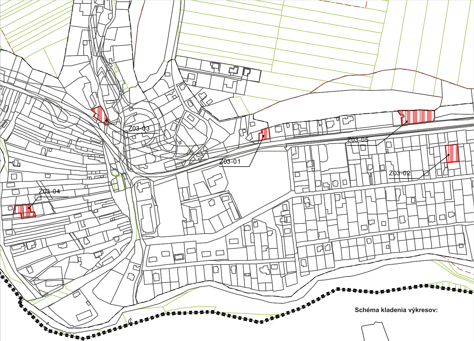
Schéma kladenia výkresov: