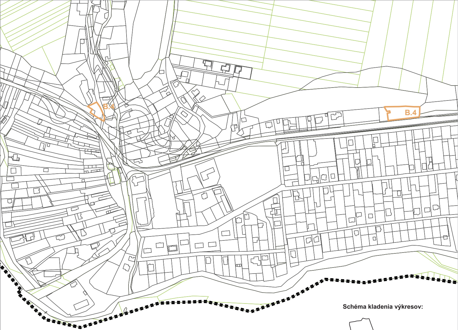
Schéma kladenia výkresov: